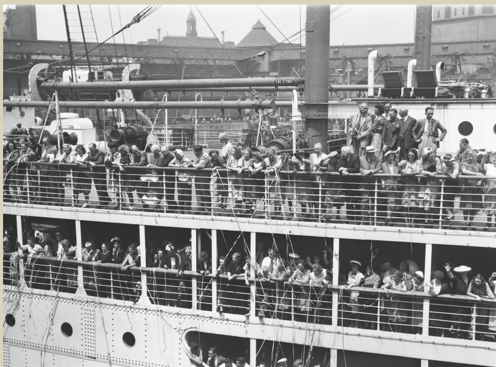
Ship Empress of Canada, 26 juillet 1947 / July 26, 1947

- Rachel Billette. À l'âge de 20 ans, en 1963, elle est partie pour un voyage de deux mois en Europe avec trois de ses amies de Saint-Louis-de-Gonzague.