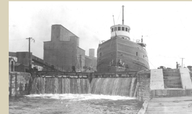
Bateau dans l'écluse n° 1 du canal de Lachine / A ship in Lock N° 1 of the Lachine Canal

L'inauguration du canal de Lachine en 1825 ouvre la route des Grands Lacs aux navires. La circulation maritime augmente dans le port, et des manufactures s'installent le long du canal, créant le premier centre industriel du pays. L'arrivée de la Voie maritime en 1959 amène la fermeture du canal en 1970. Il est réouvert en 2002 pour la navigation de plaisance.